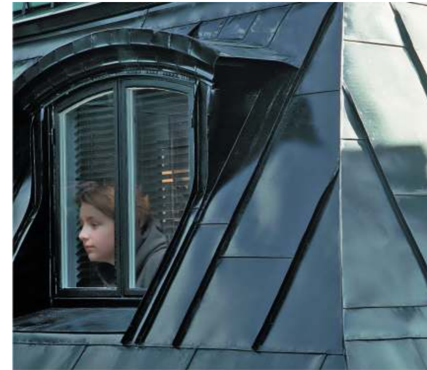
Tabla plană Lindab nu prezintă diferențe de grosime, ea fiind controlată încă din faza de producție. Acest lucru este foarte important la montaj, deoarece nu există riscul formării onduleurilor și nici al ruperii tablei în timpul manevrării și al montării.

Operațiunile de profilare și fâltuire ale tablei plane se pot realiza la cele mai scăzute temperaturi de lucru dintre toate tablele prevopsite existente pe piață în acest moment.