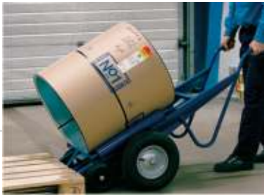
Tabla plană în fâșii trebuie să fie fixată, lucrată și manevrată corespunzător.

Căruciorul este destinat manevrării cu ușurință a rolelor de tablă din depozit în atelier sau în șantier, fără a cauza deteriorări materialului. De asemenea, el servește și ca desfășurător de tablă.